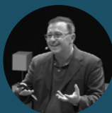
Grammenos Mastrojeni Segretario Generale aggiunto dell'Unione per il Mediterraneo